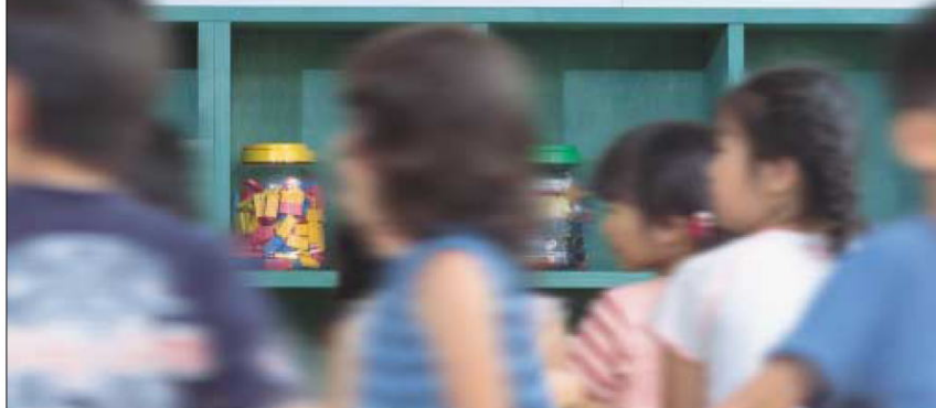
写真:朝志ヶ丘放課後児童クラブ(朝霞市放課後児童クラブ、高齢者使用多目的施設) 設計/有限会社 工務カズ 施工/高野建設株式会社

息をはずませながら、元気いっぱい走り回る子供たち。 にぎやかな笑い声ははじける朝霞市朝志ヶ丘放課後児童クラブは、 仕事の忙しいご両親にかわって、大切な子供たちをお預りする施設。 お迎えの時間まで、わが家同然の空間です。 そんな子供たちをやさしく包んでいるのが「MOISS」。 有害物質を一切含まず、他の建材や家具から発生する 様々な有害物質をも吸着するMOISSなら安心。 いま、社会問題となっているシックスクールの心配ありません。 子供たちに何よりもきれいな空気を。 そんな思いが、この空間に息づいているのです。